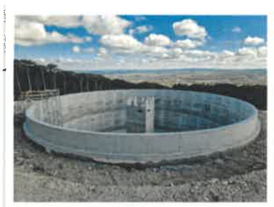
Hochbehälter und Ortsbehälter Bad Vöslau